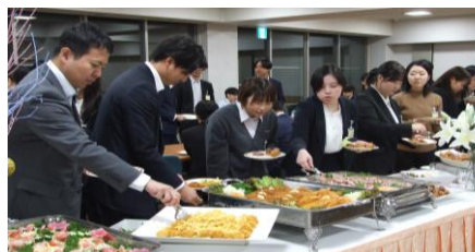
懇親会でのひととき（10月7日）