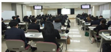
地方自治のしくみ(10月21日)