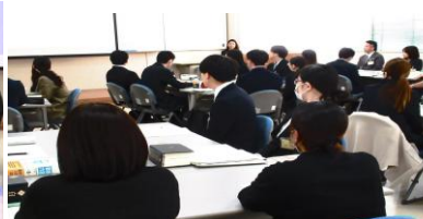
地方公務員制度（11月6日）