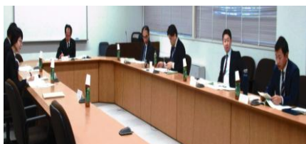
活発に意見交換する委員の皆さん↑