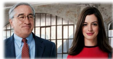
映画「マイ・インテンション」◎より 《イメージ写真》