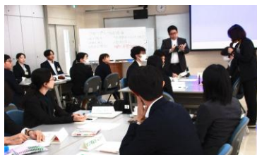
公務員としての使命（11月4日）