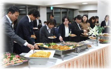
【階層別研修】新規採用職員研修 懇親会でのひととき (昨年10月)