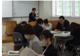
← 研修指導者フォロー研修(昨年7月)