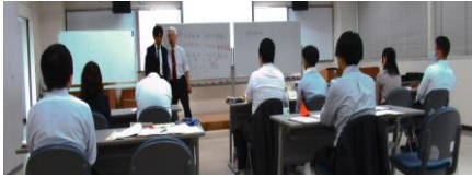
←「公務員としての使命」指導者養成研修 (令和6年5月)

研修所では、職場で実践できる研修指導者を隔年で養成しています。来年度は「公務員としての使命」（新規採用職員研修科目）を開催します。（※研修内容の詳細は『研修概要』48ページを参照） また認定後は、能力向上や成長を切れ目なく支援します。貴団体からの受講者をお待ちしています。