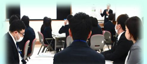
研修担当職員研修の様子(昨年4月)

前半、研修所派遣研修の手続き・注意点など実務を中心にご案内します。後半は研修担当者の具体的な役割、職員のキャリア支援の動向と背景など、皆さんで体験しながら意見交換します。